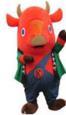
(木古内町キャラクター 「キーコ」)