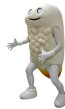
(北斗市キャラクター 「ずーしーほっきー」)