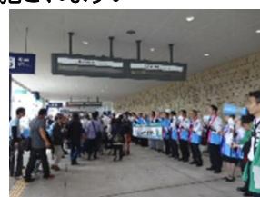
(お出迎えイメージ)

日 時 2018年3月10日(土)10:00~14:00頃 場 所 函館駅、新函館北斗駅、木古内駅、 奥津軽いまべつ駅、新青森駅