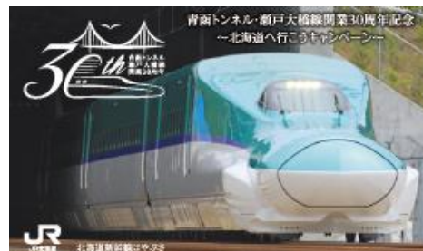
(オリジナル列車カードイメージ)