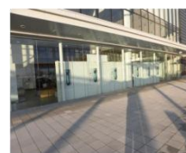
(パネル展イメージ)